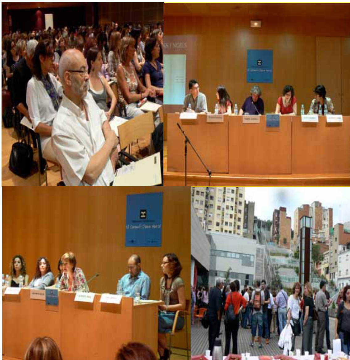
Seminari Interxarxes: “Joves llatins i grups de risc: realitats i propostes d'intervenció” 27 de maig. Biblioteca El Carmel – Juan Marsé